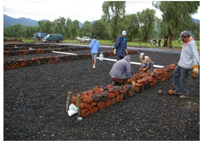
Protección tuberías ranuradas. Humedal de flujo vertical