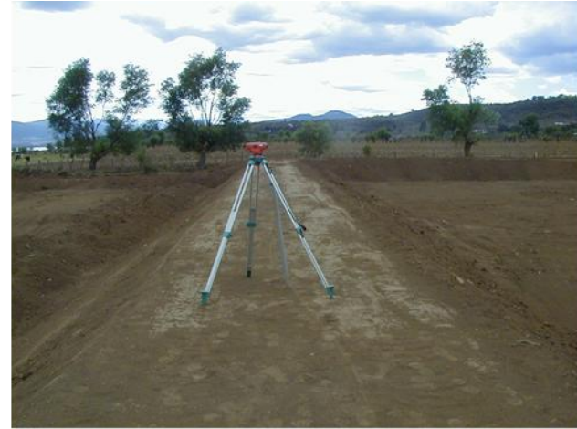
Nivelación de los bordos