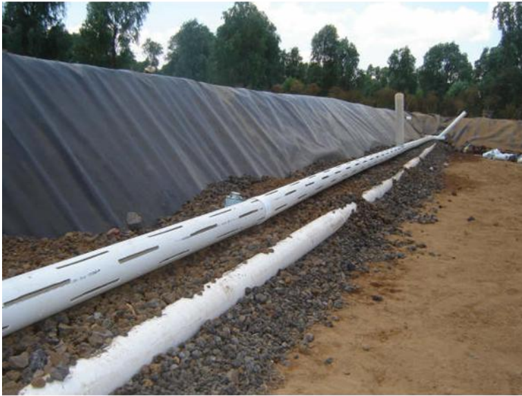
Cabezales. Colocación y nivelación de tuberías ranuradas.