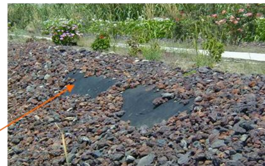
Protección de la geomebrana