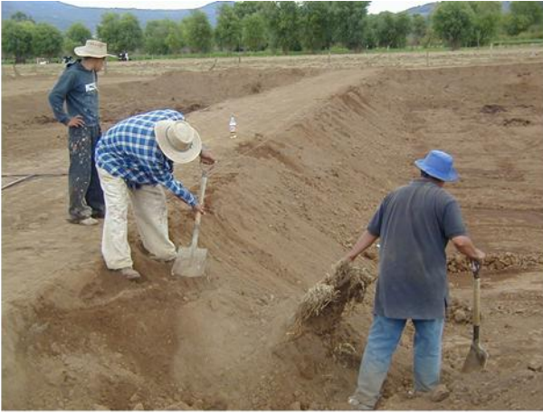
Inclinación de los taludes