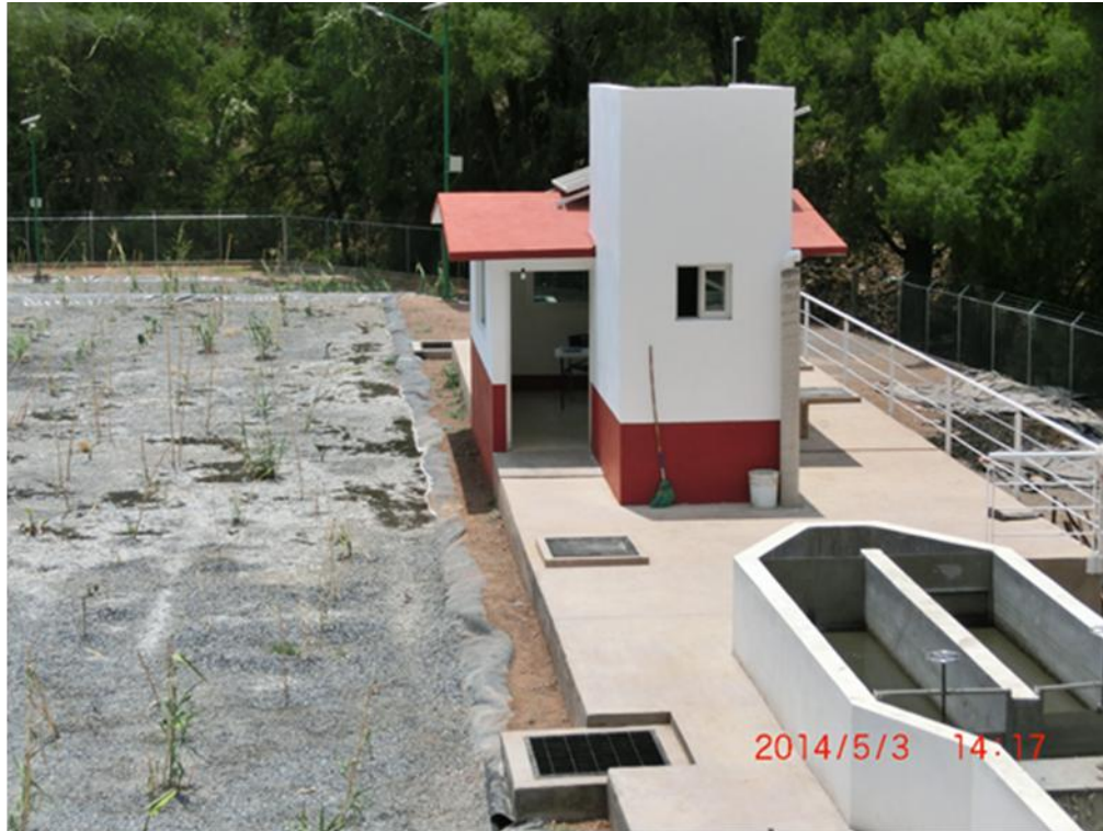
Caseta sobre el biodigestor anaerobio