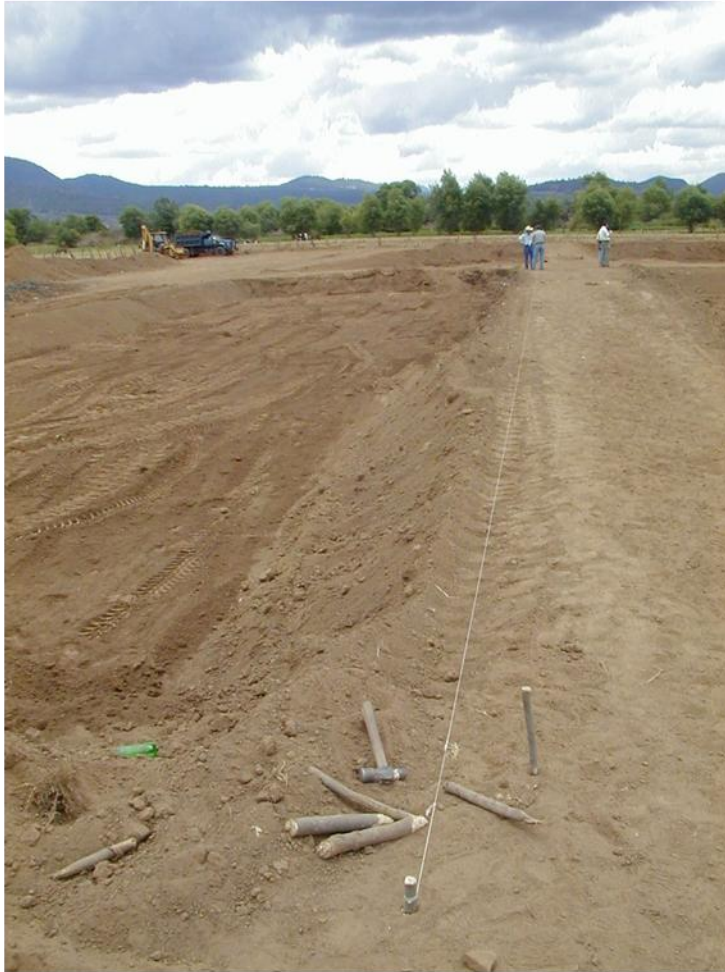
Bancos de nivel $$$$$$