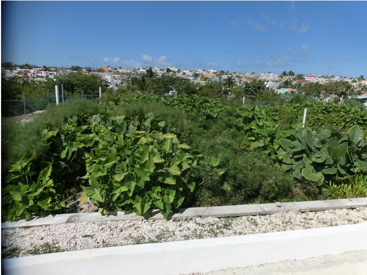
Biodiversidad de vegetación