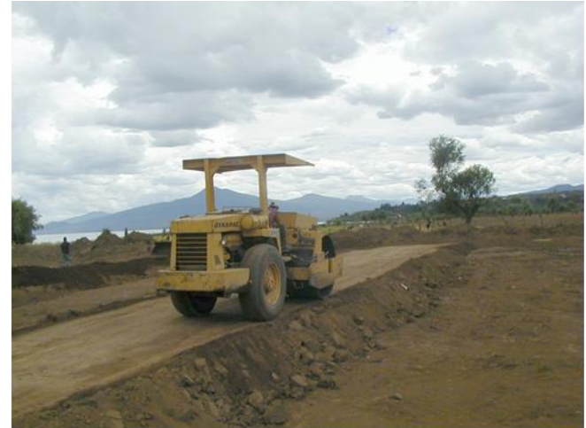
Compactación de bordos